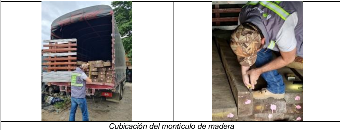
Cubicación del montículo de madera