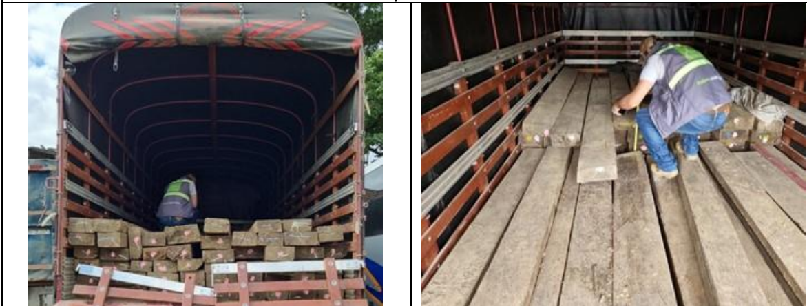
Arrumes distribuidos en el camión