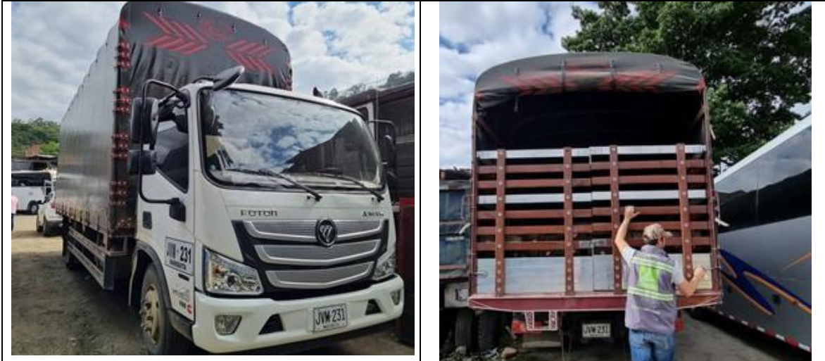
Vehículo de placas JVM231